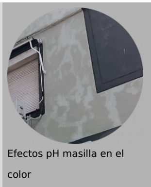
Efectos pH masilla en el color

Es fundamental prestar atención al pH del material sobre el que vamos a aplicar la pintura. Pinturas, emplastes, morteros y masillas con pH elevados pueden provocar alteraciones en el producto y atacar aspectos como su anclaje o color. No aplicar sobre productos a la cal, silicatos o masillas y emplastes con pH elevados, en el caso de necesitar emplastecer se recomienda usar masillas y emplastes Jafep, formulados con pH controlado y compatibles con los sistemas de acabado.