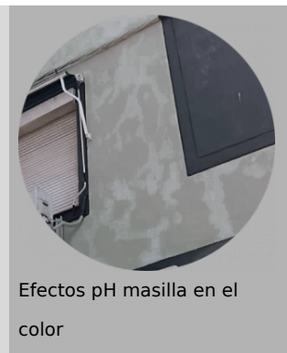
Efectos pH masilla en el color

Es fundamental prestar atención al pH del material sobre el que vamos a aplicar la pintura. Pinturas, emplastes, morteros y masillas con pH elevados pueden provocar alteraciones en el producto y atacar aspectos como su anclaje o color. No aplicar sobre productos a la cal, silicatos o masillas y emplastes con pH elevados, en el caso de necesitar emplastecer se recomienda usar masillas y emplastes Jafep, formulados con pH controlado y compatibles con los sistemas de acabado.